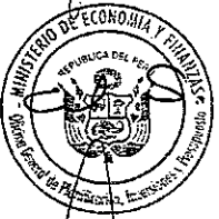
LUIS MIGUEL CASTILLA RUBIO Ministro de Economía y Finanzas