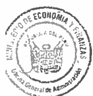
CARLOS AUGUSTO OLIVA NEYRA Ministro de Economía y Finanzas