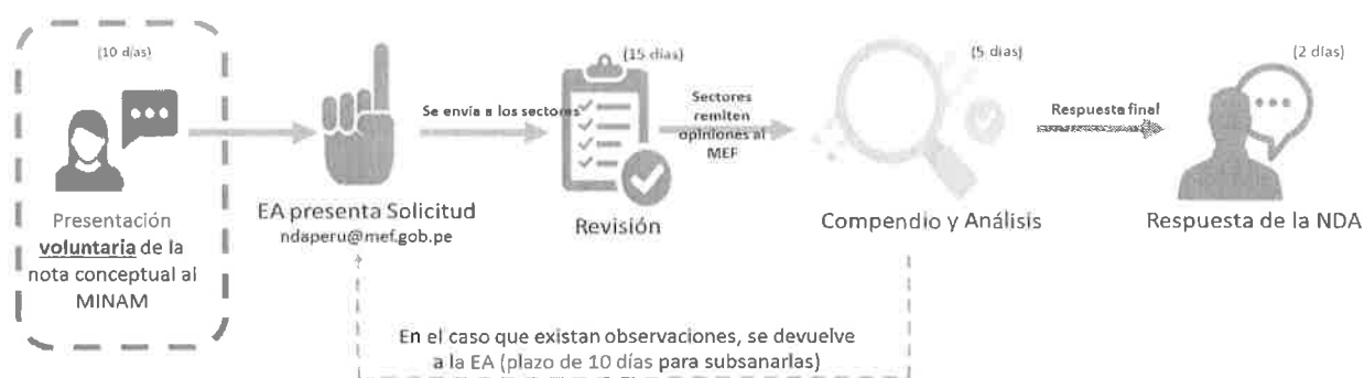
Figura 2: Flujograma del procedimiento de No Objeción