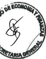
LUIS MIGUEL CASTILLA RUBIO Ministro de Economía y Finanzas