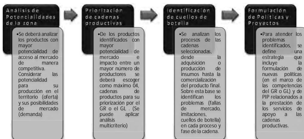
Gráfico N° A.1.1: Proceso de selección de cadenas productivas y proyectos

El esquema que se presenta en el siguiente gráfico, resume el proceso de priorización de cadenas productivas y la identificación de los PIP de servicios de apoyo al desarrollo productivo en éstas.