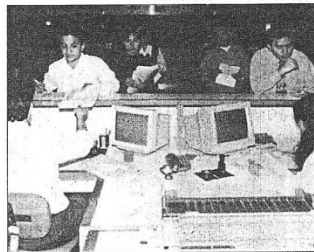
Identificarán a personas que pese a registrar ingresos no cumplen con obligaciones.

UN vasto programa de fiscalización a personas naturales por incremento patrimonial no justificado diseñó la Superintendencia Nacional de Administración Tributaria (Sunat) como parte de las acciones de fiscalización realizadas para ampliar la base tributaria, reducir los niveles de evasión y lograr el adecuado cumplimiento de las obligaciones tributarias de las personas naturales. Se espera que, mediante la realización de cruces informáticos, la administración tributaria pueda identificar contribuyentes que realizan actividades económicas que generan ingresos y, sin embargo, no cumplen con el pago de sus obligaciones fiscales respectivas. El objetivo es determinar las rentas no declaradas en atención a la comparación de los ingresos percibidos por el contribuyente o informados por los agentes de