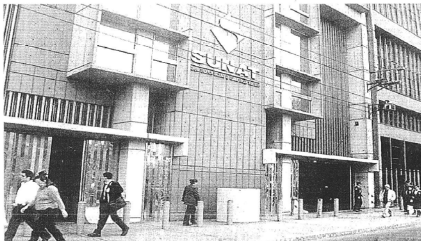
Contribuyentes. Sunat cuenta con información bancaria, bursátil, notarial, registral, entre otros, para cruce de información.

No pocas personas creen que todavía existe el secreto bancario y que determinada información no es accesible para SUNAT, lo cual es falso. Si usted mueve dinero a través de una