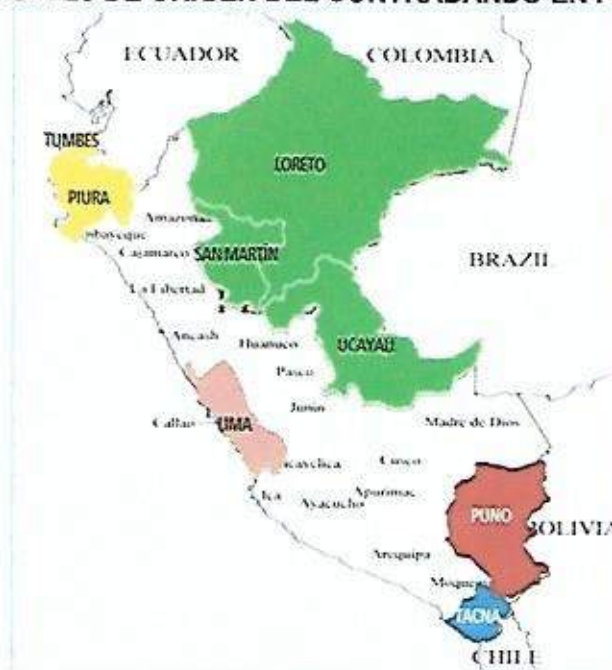
Gráfico 2 FUENTES DE ORIGEN DEL CONTRABANDO EN PERÚ