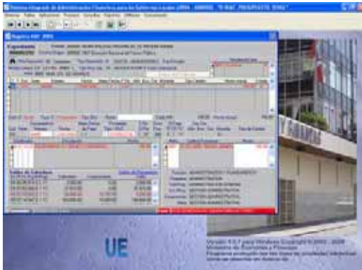
Pantalla N° 9

El Compromiso regresará rechazado con el mensaje de Error: 0236 GENERICA NO VALIDA PARA ACT/PROY. Ver Pantalla N° 9