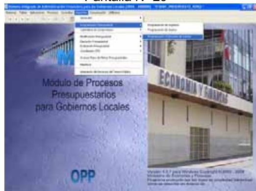
Pantalla N° 29

3.4 En el Módulo de Procesos Presupuestarios (MPP) se ha incorporado en el Submódulo Reportes, Opción Programación Presupuestal / Programación y Ejecución de Gastos. (Marco Presupuestal a la fecha de emisión del Reporte). Ver Pantalla N° 29