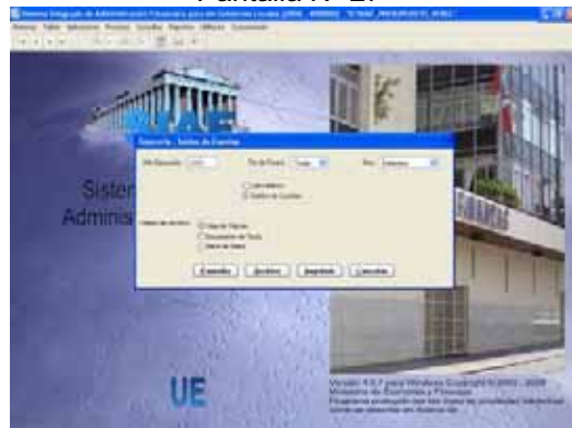
Pantalla N° 27

A través de este Reporte el Usuario podrá visualizar los Saldos de todas sus Cuentas Bancarias. Ver Pantalla N° 28