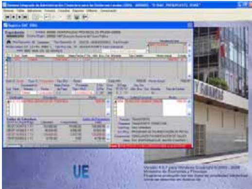
Pantalla N° 8