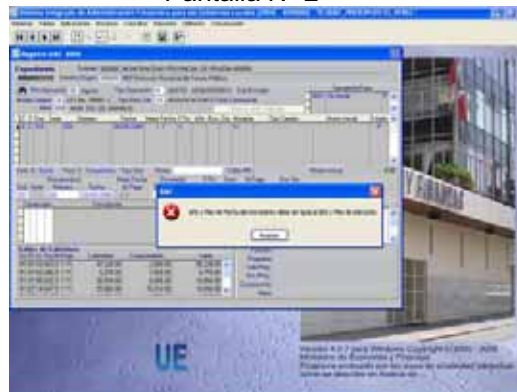
Pantalla N° 2

1.2.2 La Fecha del Devengado debe ser igual o mayor a la fecha del Compromiso, caso contrario el Sistema mostrará el mensaje Fecha no puede ser menor a la Fecha del Compromiso . Ver Pantalla N° 3