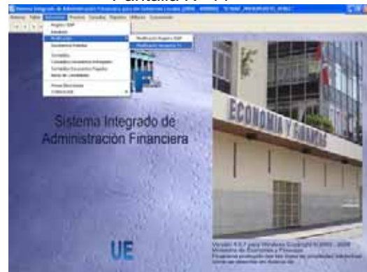
Pantalla N° 11

Para proceder a la modificación, dar clic con el botón derecho del Mouse y seleccionar la opción Crear Modificación . Ver Pantalla N° 12.