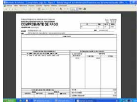
Pantalla N° 10

Cuando se reasigna una operación de Gastos, se visualiza la Razón Social en el Comprobante de Pago. Ver Pantalla N° 10.