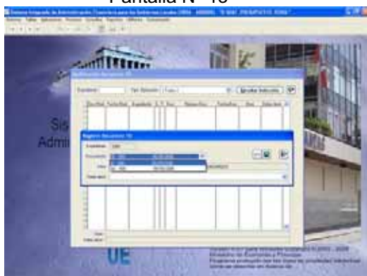
Pantalla N° 13

A continuación seleccionará el número del Secuencial que reemplazará al original, y, procederá a dar clic en el botón Grabar. Luego con el botón derecho del Mouse habilitará para envío. Ver Pantallas N° 14 y 15.