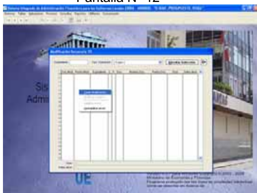
Pantalla N° 12

El Usuario digitará el número del Expediente a modificar, seguidamente seleccionará el Ciclo (Ingresos ó Gastos). Ver Pantalla N° 13.