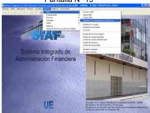
Pantalla N° 19

3.2. En Submódulo Reportes, Tesorería se ha incorporado la opción Operaciones Pendientes , Compromisos por Devengar y Devengados por Girar. Estos Reportes tienen Filtros Del Mes y al Mes. Ver Pantallas N° 22 y 23.