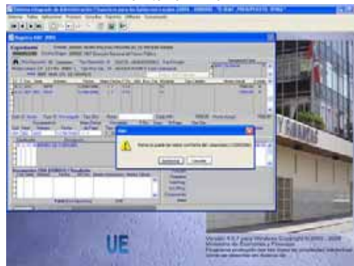
Pantalla N° 3

1.2.3 La Fecha del Girado debe ser igual o mayor a la fecha del Devengado, caso contrario el Sistema mostrará el mensaje Fecha no puede ser menor a la Fecha del Compromiso . Ver Pantalla N° 4