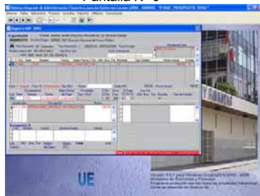
Pantalla N° 6

Esto se aplicará en el Ingreso Determinado, con el mensaje de Error: 0335 FUENTE NO PERMITIDA PARA EL CLASIFICADOR. Ver Pantalla N° 6