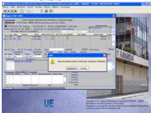
Pantalla N° 4