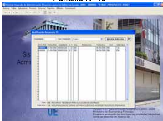
Pantalla N° 18

de Recurso y Fuente de Financiamiento. A la vez podrá verificar el Saldo de Calendario. Este se mostrará por Función/Programa/Genérica y Tipo de Recurso. Ver Pantalla N° 21