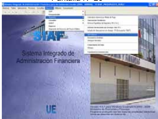
Pantalla N° 26

El Reporte consta de dos Filtros: Por Fuente de Financiamiento y por Mes. Ver Pantalla N° 27.