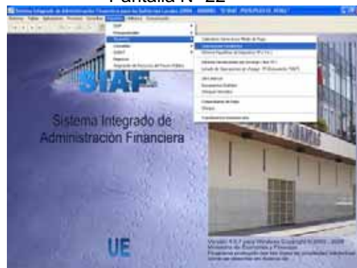
Pantalla N° 22

Este Reporte tiene filtros por Mes de Ejecución y Fuente de Financiamiento. Ver Pantalla N° 20.