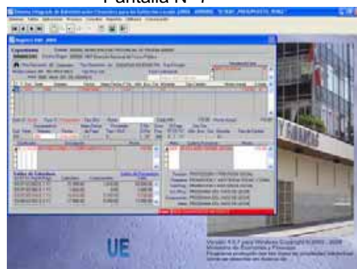
Pantalla N° 7

De la misma forma la Base de Datos del MEF rechazará las combinaciones de Clasificadores de Ingreso y Gasto errados. La Operación regresará rechazada con el mensaje de Error: 0024 CLASIFICADOR NO EXISTE. Ver Pantalla N° 7