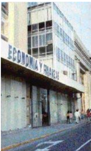
Ministerio de Economía y Finanzas

SIAF - Sistema Integrado de Administración Financiera