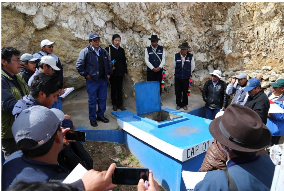
Leyenda: CP Karina, Distrito de Chucuito, Puno.

MUNICIPIOS TIPO D: Ciudades No Principales con menos de 500 Viviendas Urbanas