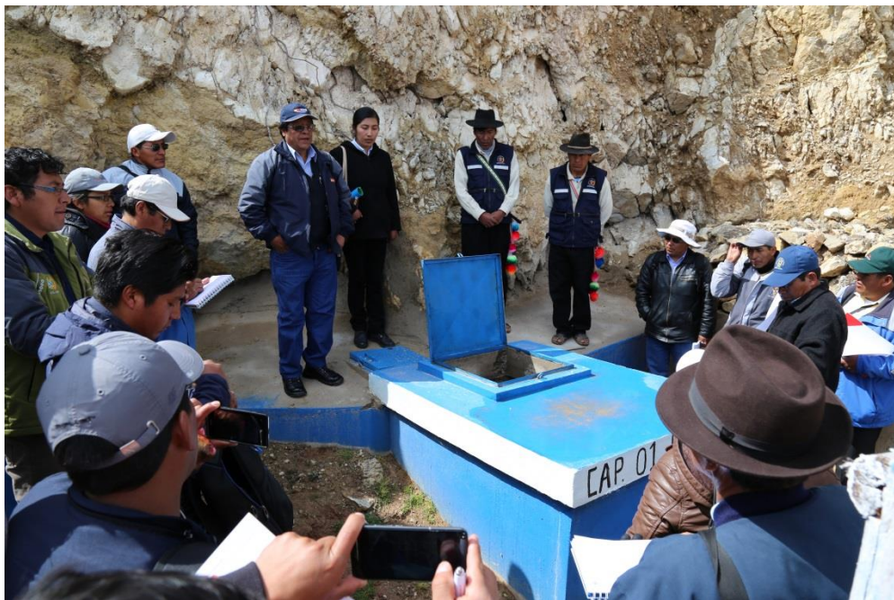
Leyenda: CP Karina, Distrito de Chucuito, Puno.

MUNICIPIOS TIPO D: Ciudades No Principales con menos de 500 Viviendas Urbanas