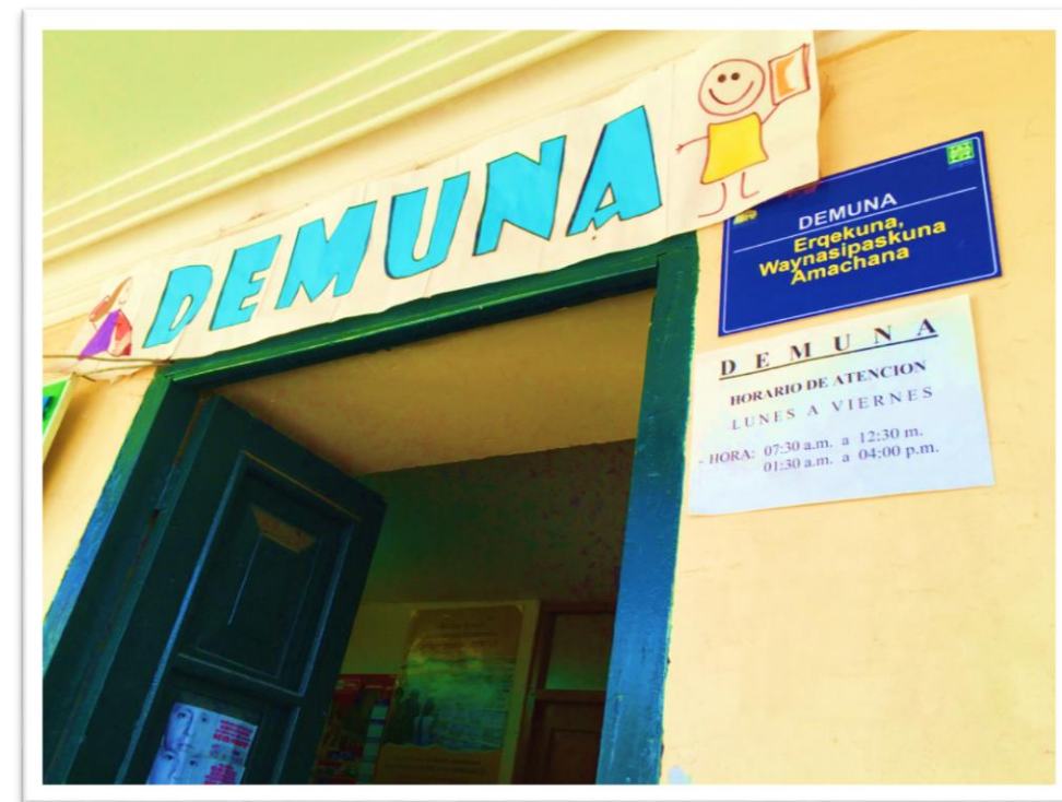
DEMUNA de San Jerónimo - Cusco