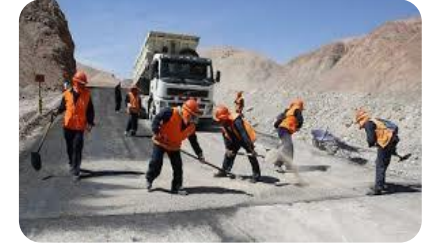
Obras sin funcionamiento