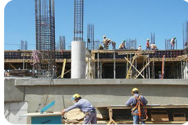
Obras con plazos incumplidos