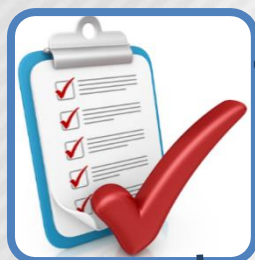
Imagen Pública y Política