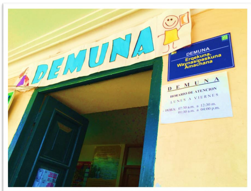
DEMUNA San Jerónimo - Cusco

Calidad en la atención y promoción de factores de protección para niñas, niños y adolescentes desde la Defensoría Municipal del Niño y del Adolescente – DEMUNA