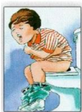
Prevalencia de EDAS - Establecimiento de Salud