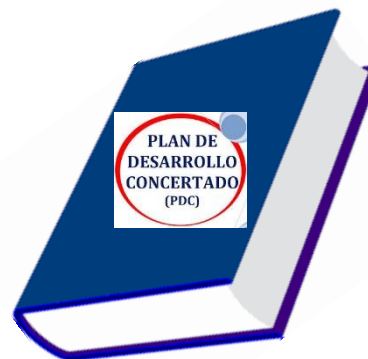
PDC Municipalidad Distrital