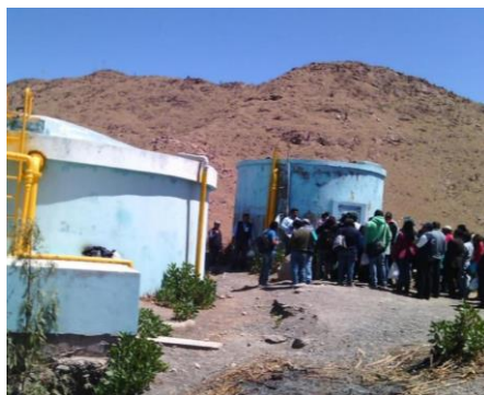
Estado situacional de los SAS rurales (Encuesta)