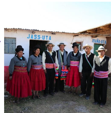
Organizaciones Comunales prestadoras de SAS