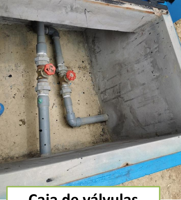
Caja de válvulas