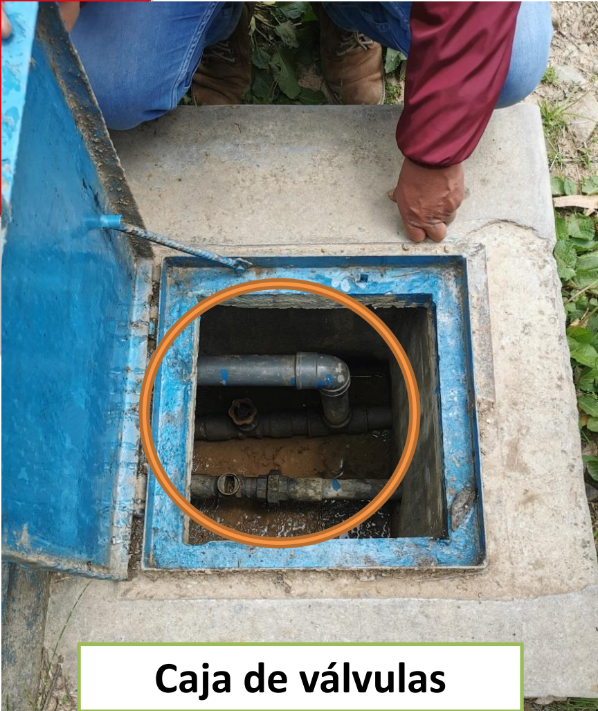
Caja de válvulas