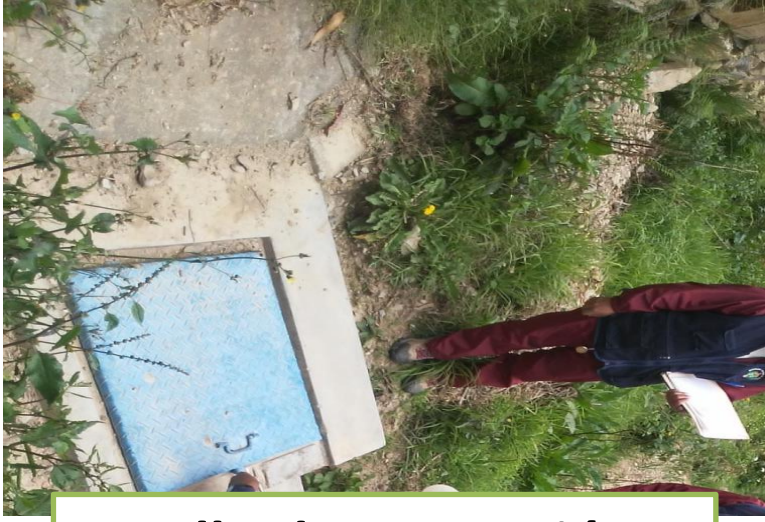
Sello de protección