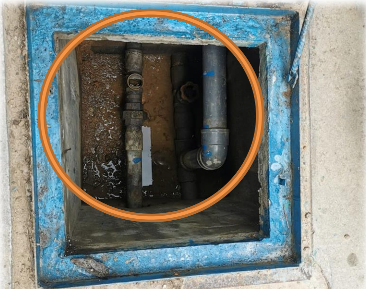
Caja de válvulas