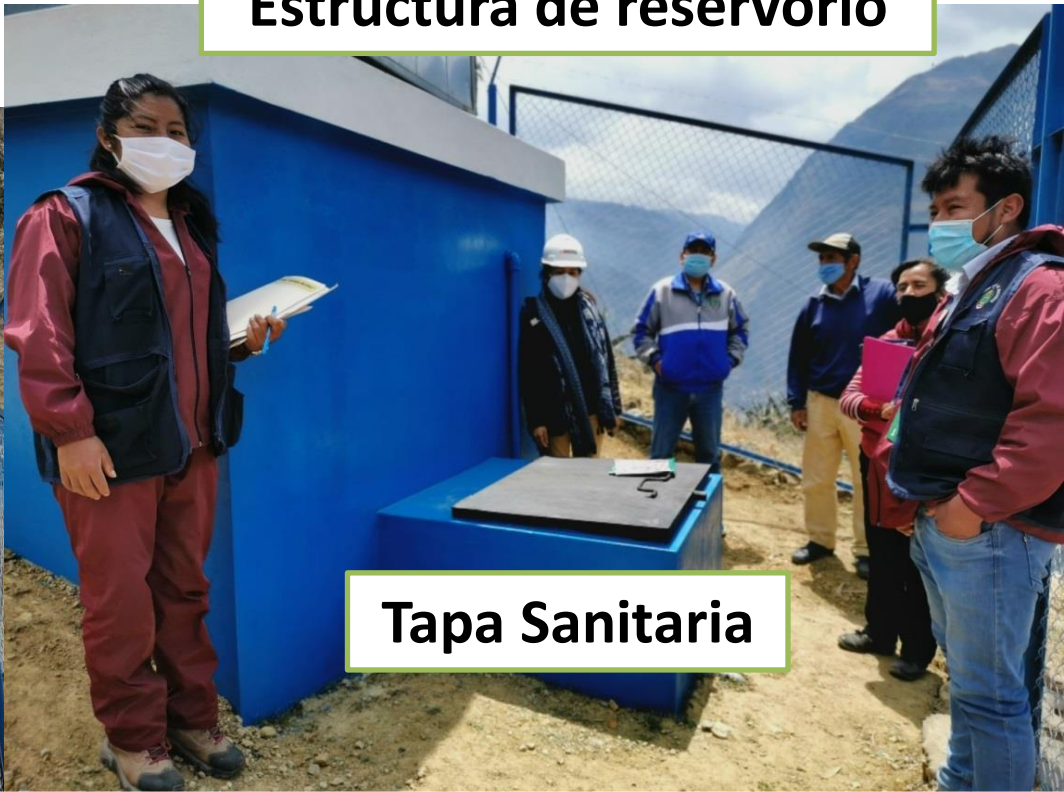
Estructura de reservorio