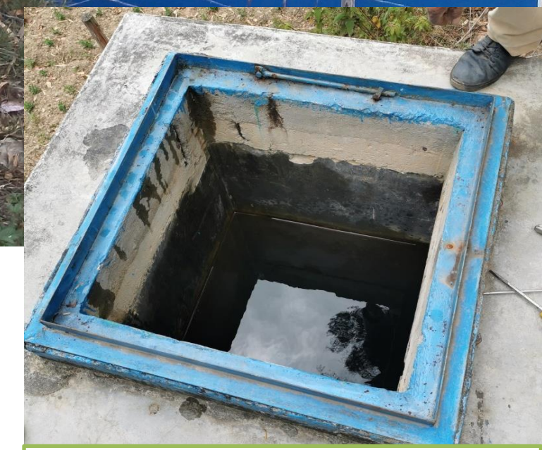
Interior de la estructura