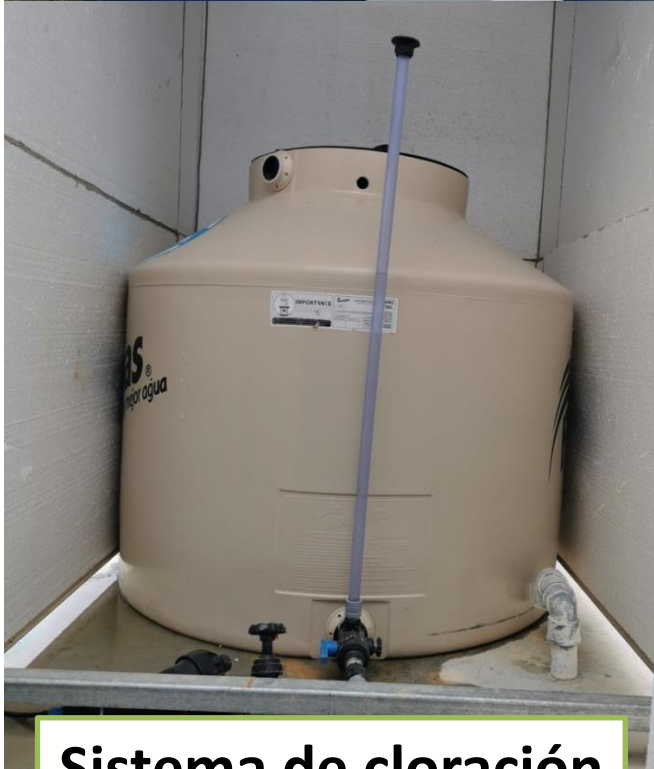
Sistema de cloración