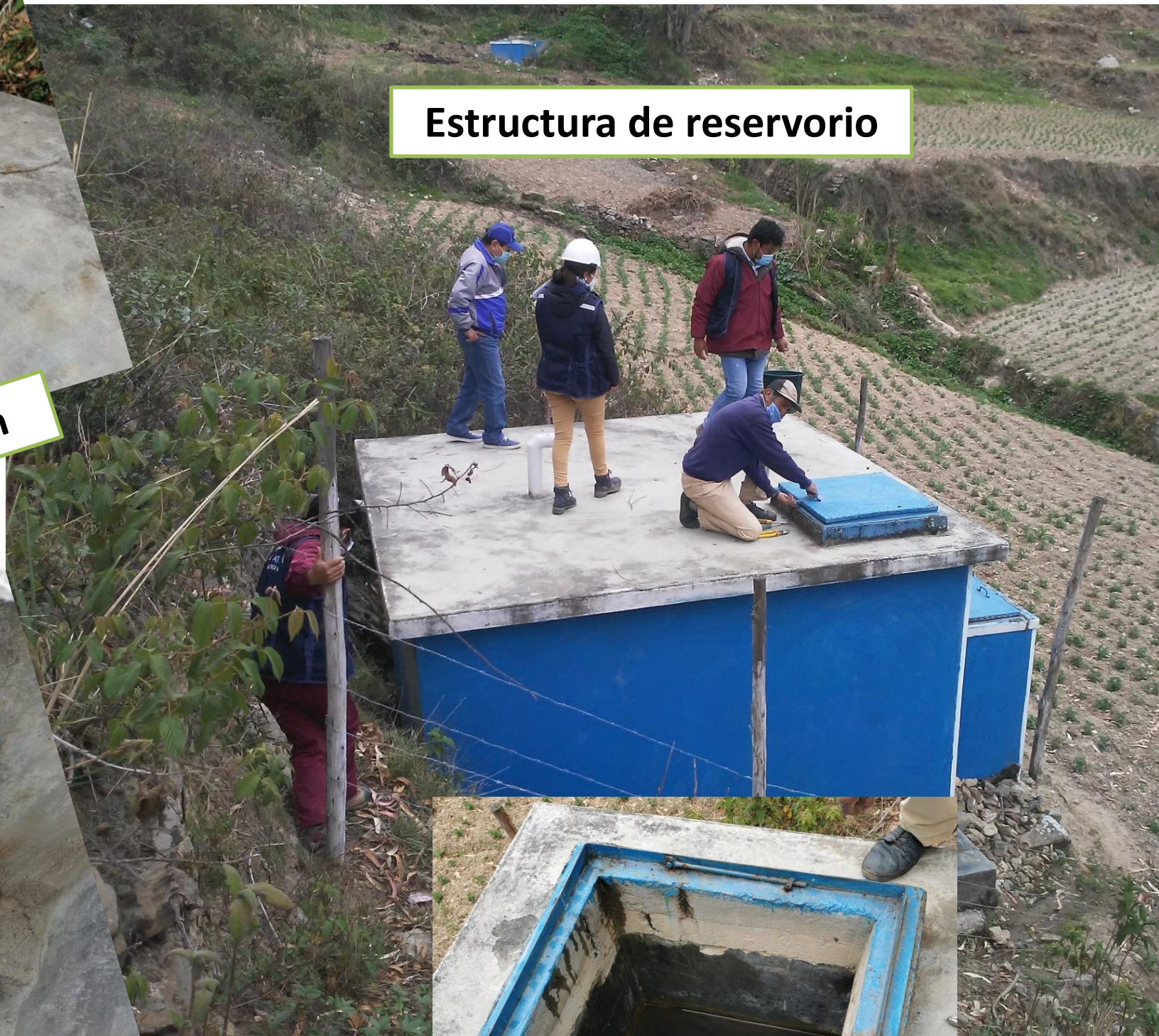
Estructura de reservorio