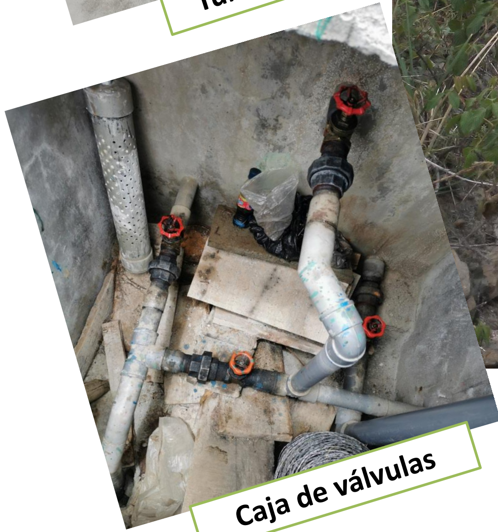
Caja de válvulas