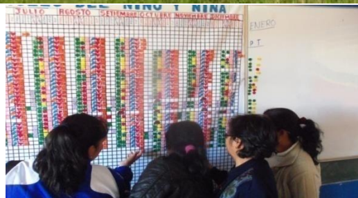
Vigilancia de prácticas saludables