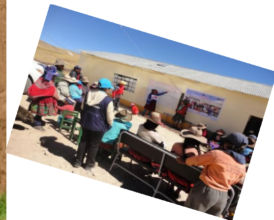
Análisis y toma de decisiones