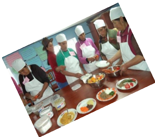
Educación en prácticas saludables

CENTRO DE PROMOCION DE LA SALUD Y VIGILANCIA COMUNAL COMO UNA DE LAS INTERVENCION ES PARA REDUCIR LA DESNUTRICION CRONICA INFANTIL