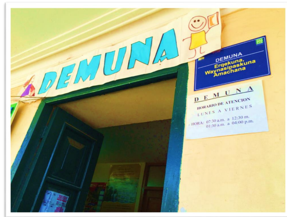
DEMUNA de San Jerónimo - Cusco