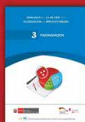
3 | Fiscalización