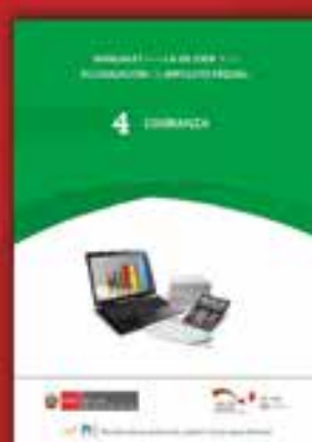
4 | Cobranza