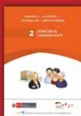
2 | Atención al contribuyente