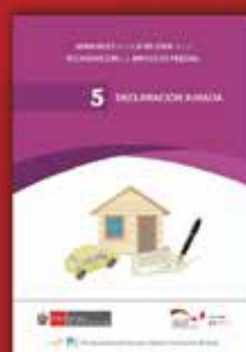
5 | Declaración Jurada