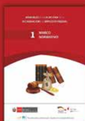
1 | Marco Normativo