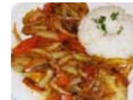
ESCABECHE DE PALLARES CON HUEVO – R1