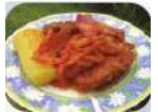
CHUPISHCA DE PESCADO – R4