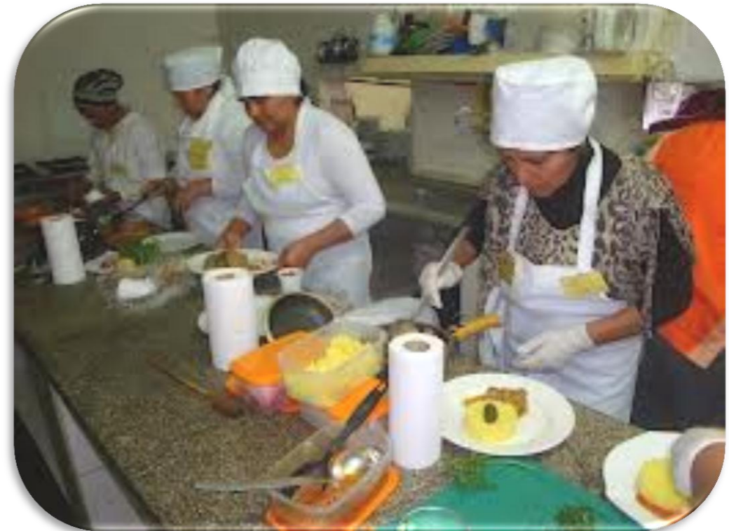
Manual de gestión del servicio alimentario