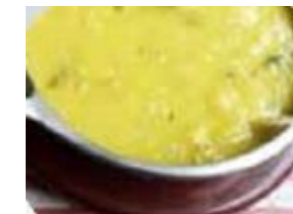
POCOTE DE OLLUCO – R5