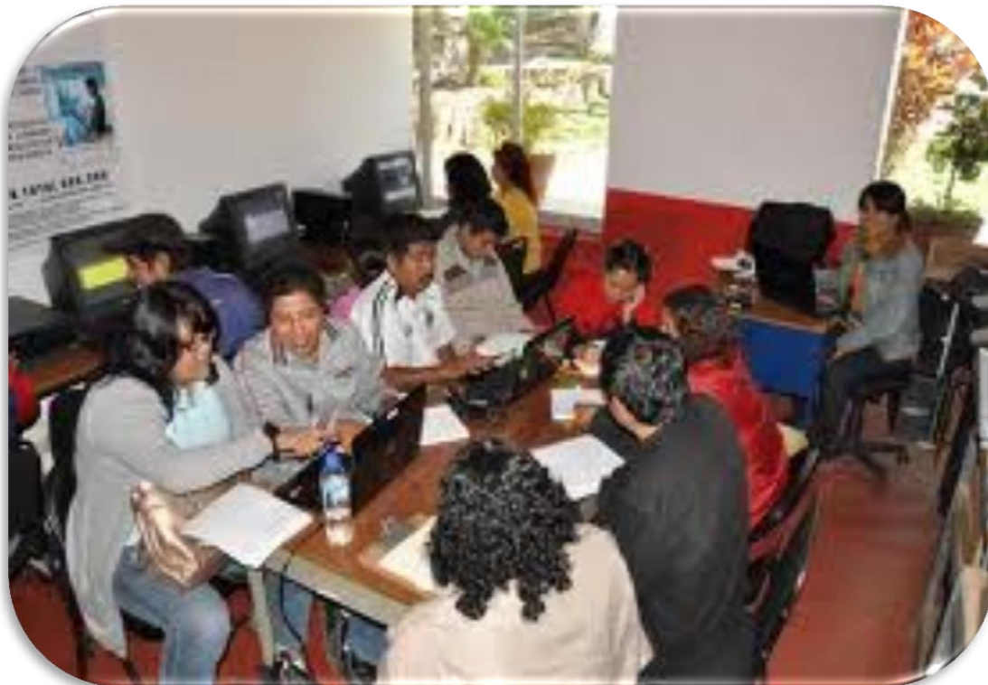
Manual de compras y rendición de cuentas