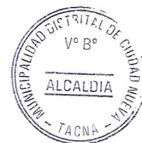
Sello del titular