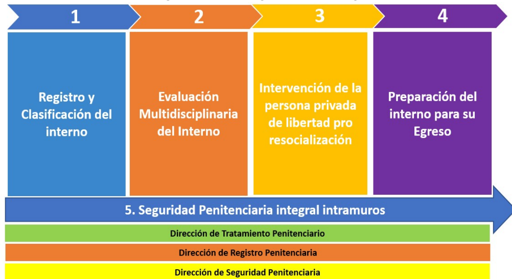
ILUSTRACION N° 2: IDENTIFICACIÓN DE PROCESOS / SUBPROCESOS DE LA UP "ESTABLECIMIENTO PENITENCIARIO"

Conforme se puede apreciar en la Ilustración N° 3, los procesos identificados son cinco (05): cuatro (04) procesos fundamentales 3 y un (01) proceso transversal que garantizan la adecuada gestión y tratamiento resocializador de las personas privadas de libertad y los cuales se detallan de manera resumida a continuación.