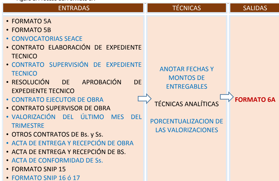
Figura 1. Proceso del Formato 6A

En el ciclo de vida para la ejecución de proyectos se tiene identificado etapas, fases o componentes, bien marcados, que corresponden a los siguientes: 1) Expediente Técnico y/o