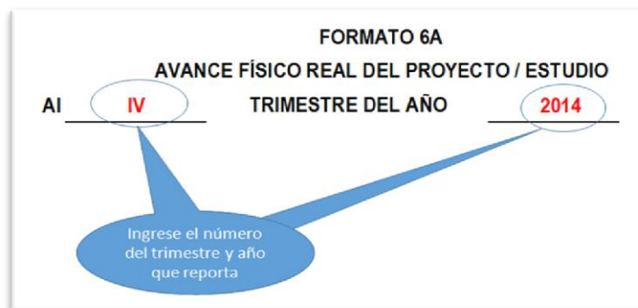
Figura 6. Ejemplo de llenado del trimestre que se reporta

Corresponde presentar como primer informe el correspondiente al IV trimestre 2014, de lo ejecutado durante el 09.10.2014 al 31.12.2014.