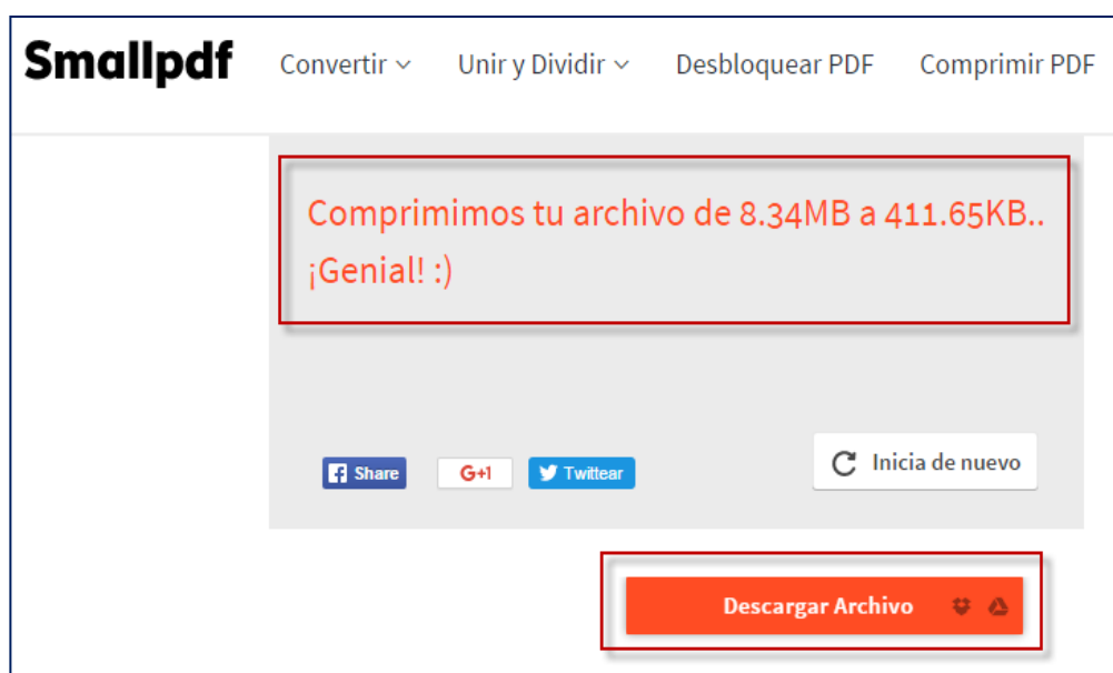
Figura 4: Acceso a descargar el archivo.

A continuación se mostrará un mensaje de conformidad donde se comprimió el documento de 8.34 MB a 412 KB y hacer clic en el botón "Descargar Archivo"