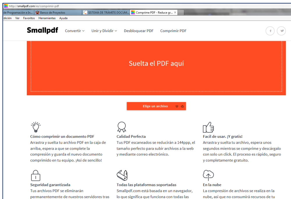
Figura 1: Acceso a la página “Smallpdf”

Para ingresar a la página SMALLPDF ir al siguiente enlace: http://smallpdf.com/es/comprimir-pdf .