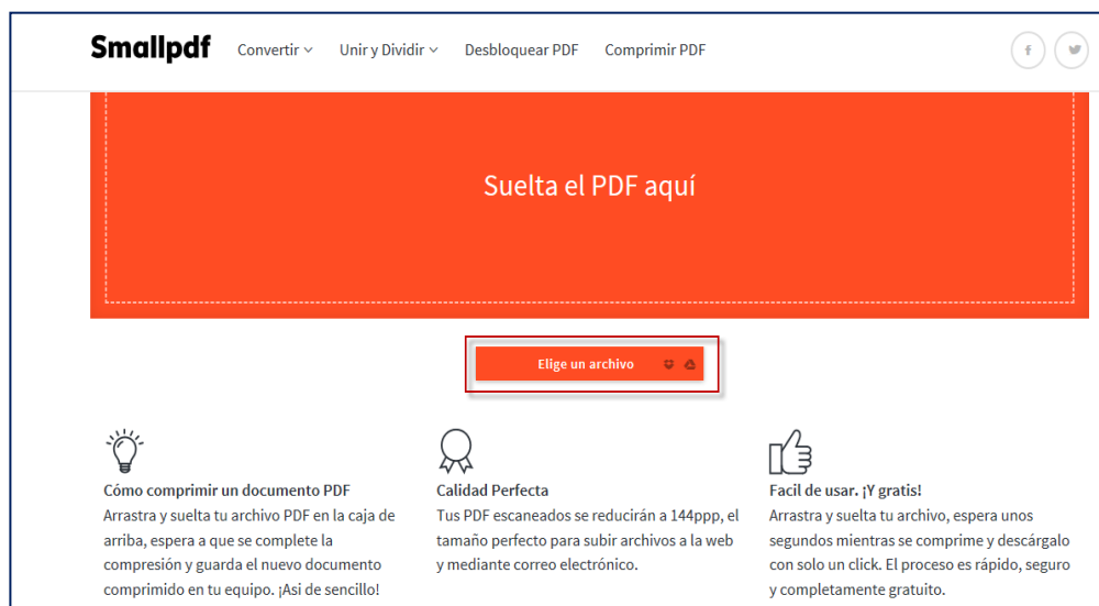
Figura 2: Acceso para adjuntar el “PDF.”

Seleccionar la opción “Elegir un Archivo” , para adjuntar el documento.