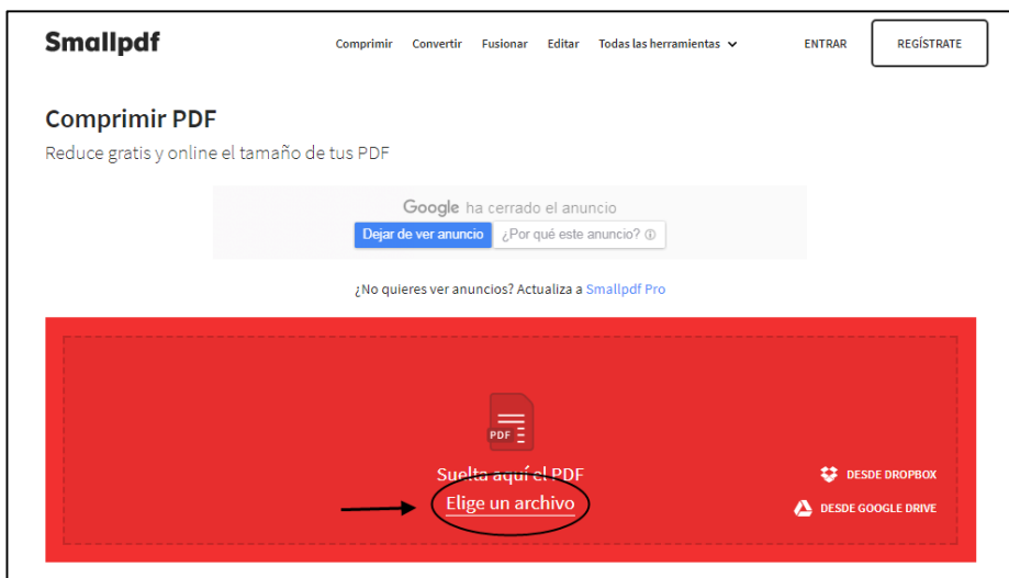
Gráfico 2. Selección de archivo