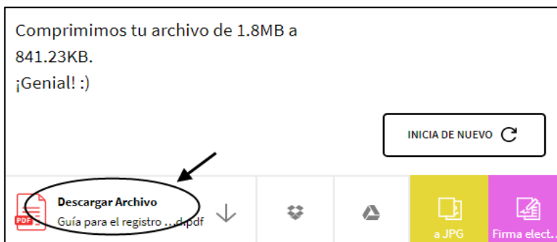
Gráfico 5. Selección de descargar archivo