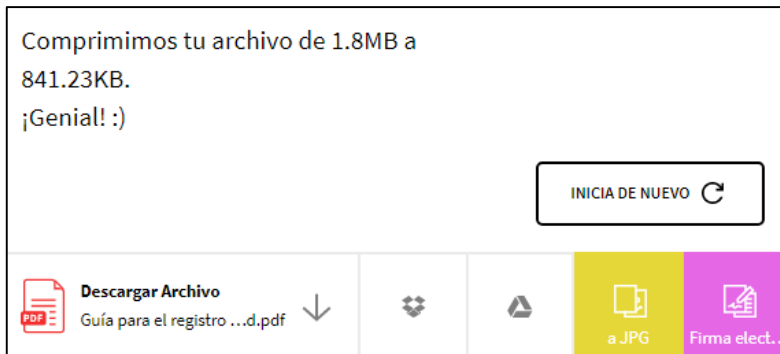
Gráfico 4. Mensaje de conformidad