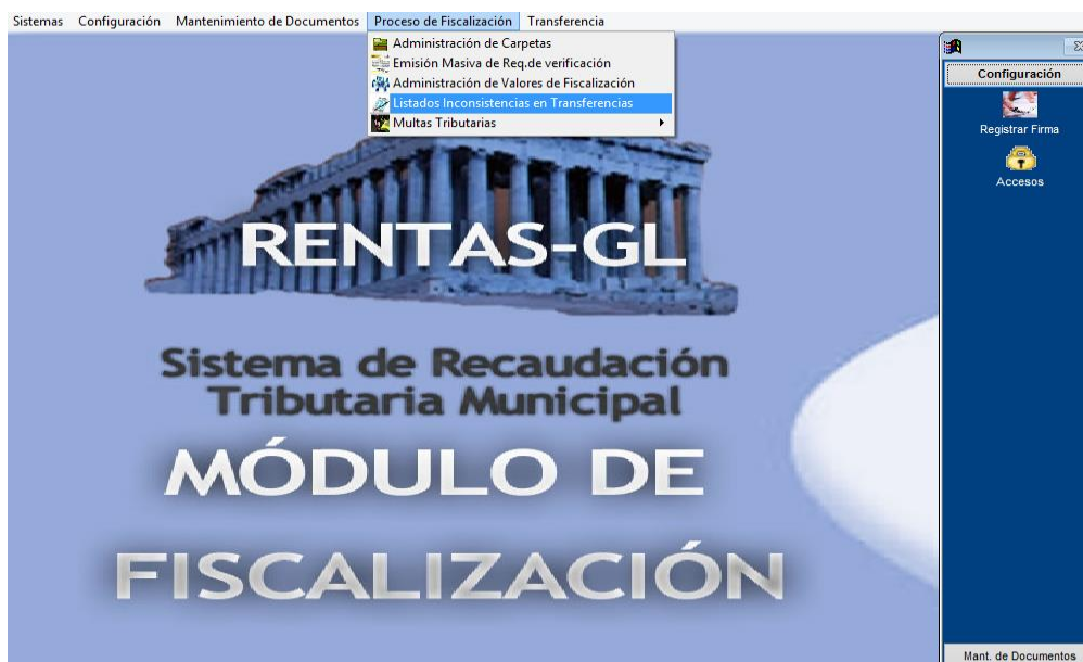
Figura N° 001

Dar clic en la opción Proceso de Fiscalización /Listado de Inconsistencia :