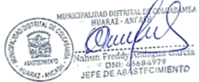
Firma 1: Responsable del Área involucrada en la gestión de la CAP