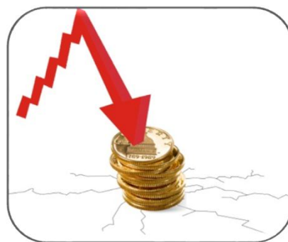
Reducción de Costos