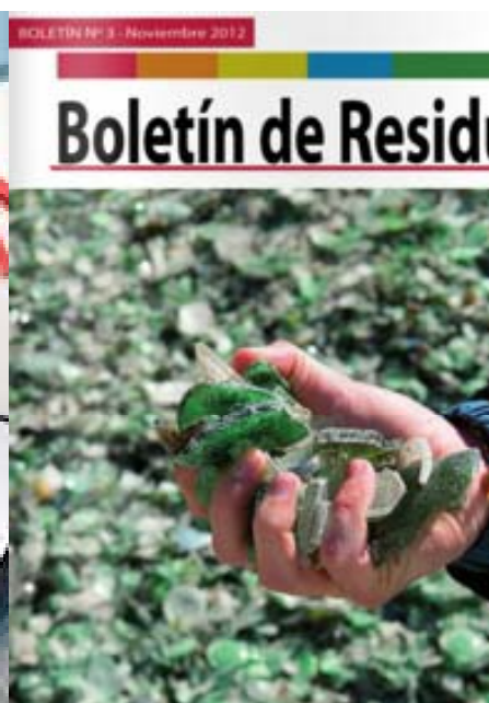
Boletines, folletos, etc.