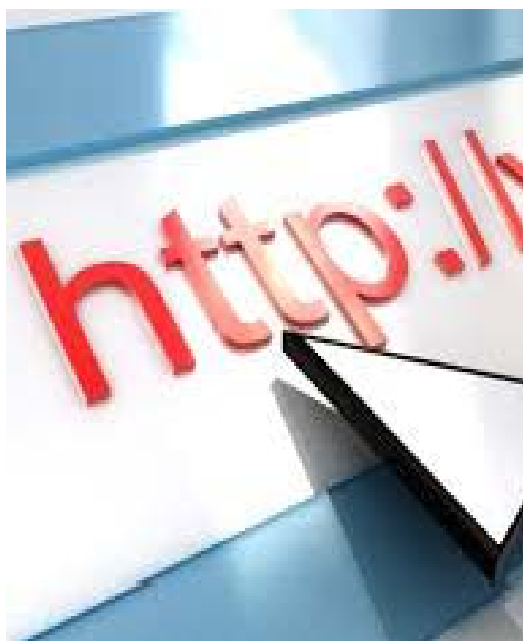
Página web actualizada

Campañas de educación y sensibilización a los ciudadanos en general