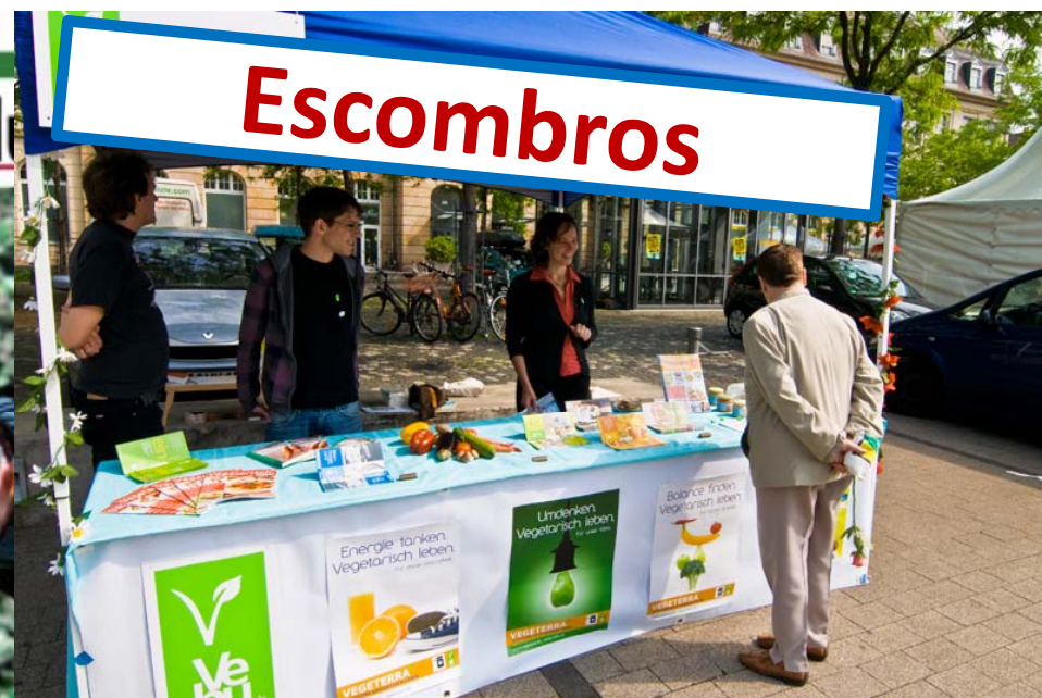
Campañas en eventos (ciclovía recreativa, etc)