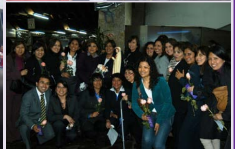
Equipo organizador del homenaje al Señor de los Milagros.